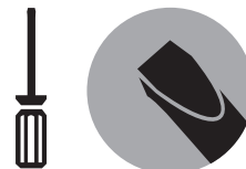
■ Flat-Head Screw Driver