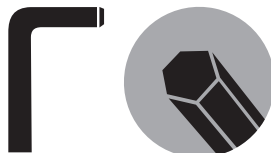
■ Hex Wrench(2.5mm)